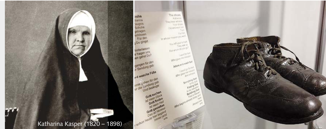
Katharina Kasper (1820 – 1898)

Gründerin der Ordensgemeinschaft Arme Dienstmägde Jesu Christi